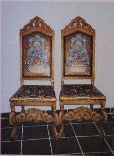
Brudestolene er i gilderler og var den første gaven fra den eldste kirkeingen.