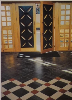
Viser del av Aud Hunskaars interiør i våpenhuset.