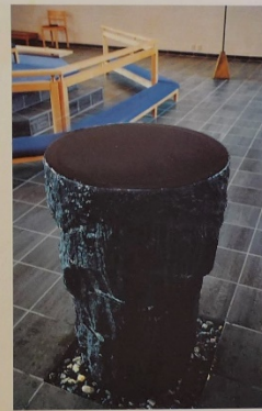
Døpefonten er i diabasstein fra Skåne, med retnende vann. Den er laget av Marit Lyckander, Oslo.