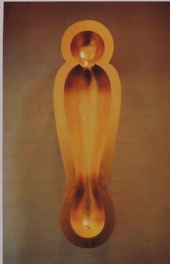
Skulpturen er i bjørk og er belagt med blodgull. Kunstner: Kristine Hjertholm, Oslo.