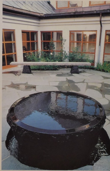
Skulpturen er i diabasstein, og har retnende vann. Kunstner: Marit Lyckander.

Det er en aksel fra døpefont til atriet. Livet som skapes i døperen lever i det fri, i verden, i hverdagen.