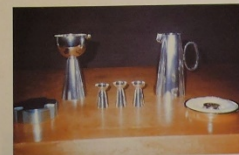
Sølv: Brødske - Kalk - Serkalk - Vinkanne - Disk. Gullsmed: Pål Vigeland Gave fra Cecilie Skjold.